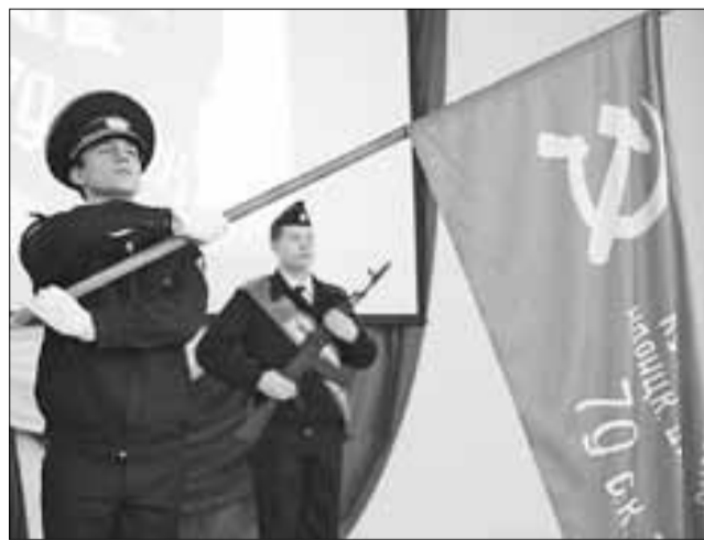
■ Копия знаменитого стяга уже побывала во многих городских школах.

– Мы долго думали, как нам подготовиться к при-