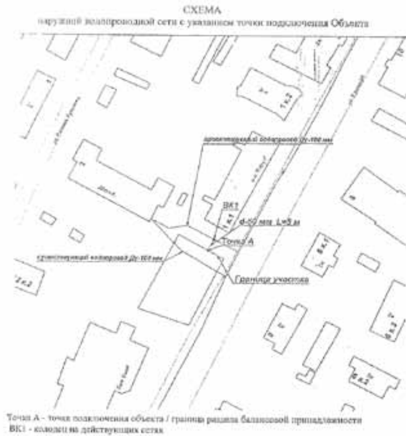
Точка А - точка подключения объекта / граница раздела балансовой принадлежности ВК1 - колодезь на действующих сетях

к техническому заданию на подготовку документации по планировке территории для размещения линейного объекта «Строительство участка канализационной и водопроводной сети по адресу: г. Архангельск, Ломоносовский территориальный округ, ул. Урицкого (между домами № 1 и № 1, корп. 1)»