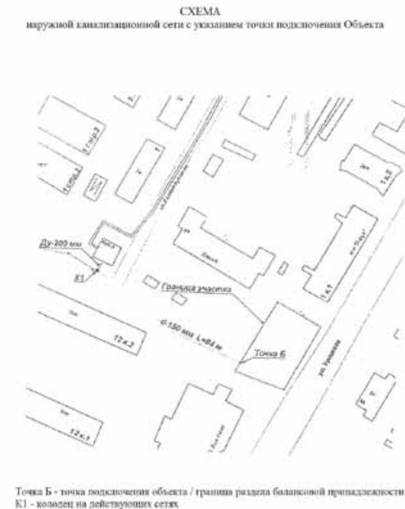
Точка Б - точка подключения объекта / граница раздела балансовой принадлежности ВК1 - колодезь на действующих сетях

Приложение № 2 к техническому заданию на подготовку документации по планировке территории для размещения линейного объекта «Строительство участка канализационной и водопроводной сети по адресу: г. Архангельск, Ломоносовский территориальный округ, ул. Урицкого (между домами № 1 и № 1, корп. 1)»