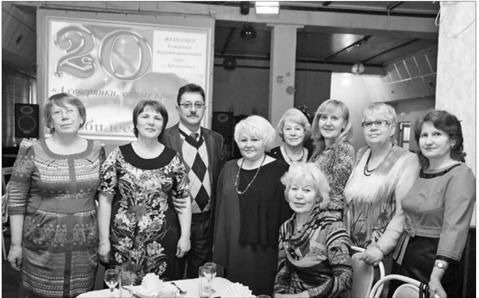
■ ФОТО: ИВАН МАЛЫГИН

Как сказала Светлана Владимировна, двадцать лет для их организации не возраст. Впереди грандиозные планы работы, много смелых творческих идей и возможностей для их воплощения.