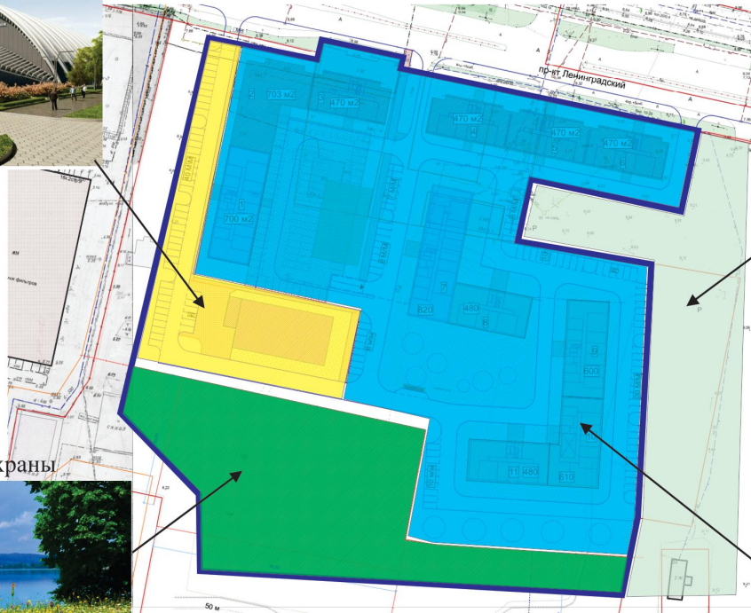
зона санитарной охраны