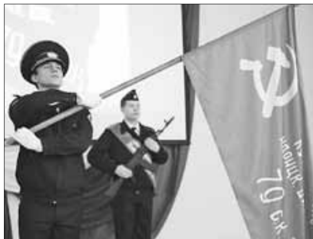
■ Копия знаменитого стяга уже побывала во многих городских школах.

– Мы долго думали, как нам подготовиться к при-