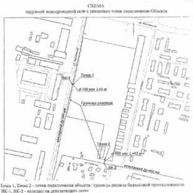
Точка 1, Точка 2 - точки подключения объекта / границы раздела балансовой принадлежности ИК-1, ИК-2 - колодцы на действующей сети

к техническому заданию на подготовку документации по планировке территории для размещения линейного объекта «Водопровод по адресу: г.Архангельск, Ломоносовский территориальный округ, ул.Касаткиной, д.10»