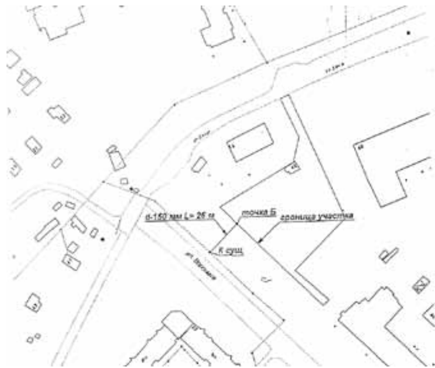
СХЕМА наружной канализационной сети с указанием точки подключения Объекта