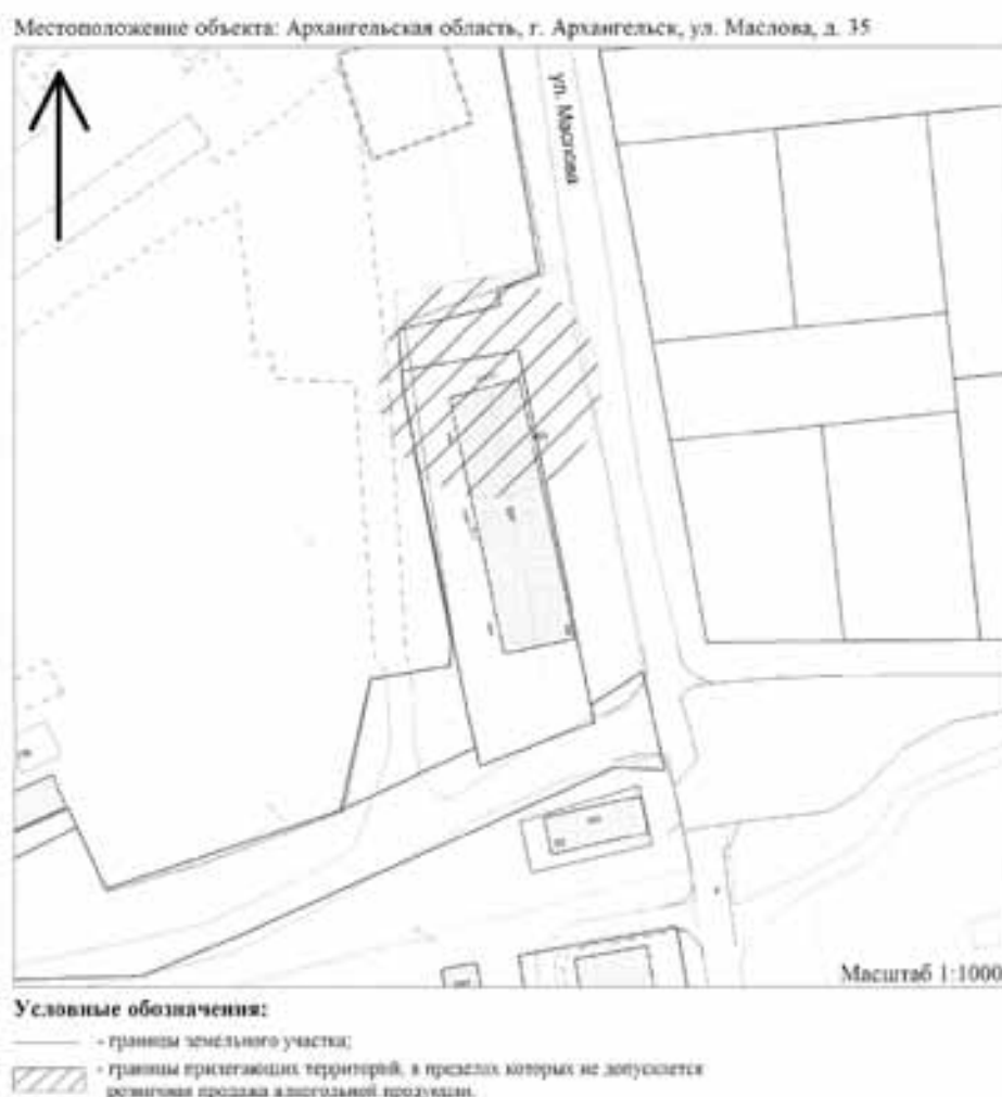
Схема № 126 границ прилегающей территории государственного бюджетного учреждения здравоохранения Архангельской области «Архангельская городская клиническая больница №7»

УТВЕРЖДЕНА постановлением мэрии города Архангельска от 07.04.2014 № 378