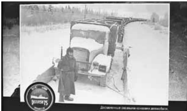
■ Уникальные кадры военных лет.

лений страны. Архангельские представители – настоящие энтузиасты, которые болеют душой за дело, проявляют инициативу. Одна из них: уже в следующем году планируют провести в столице Поморья съезд городов-героев и городов воинской славы. Важно, что все проекты, организованные РВИО, получают поддержку губернатора региона Игоря Орлова и главы Архангельска Игоря Годзиша. Это подтверждает, что есть конструктивное взаимодействие между городом, областью и общественными организациями, – сказал Михаил Мягков.