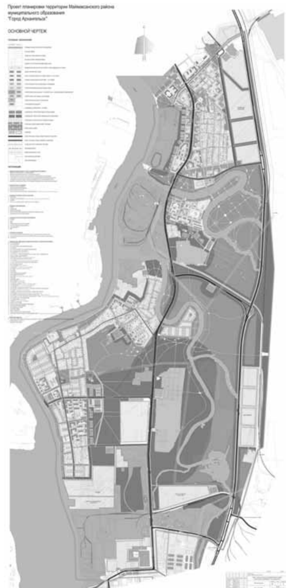
Приложение № 1 к проекту планировки