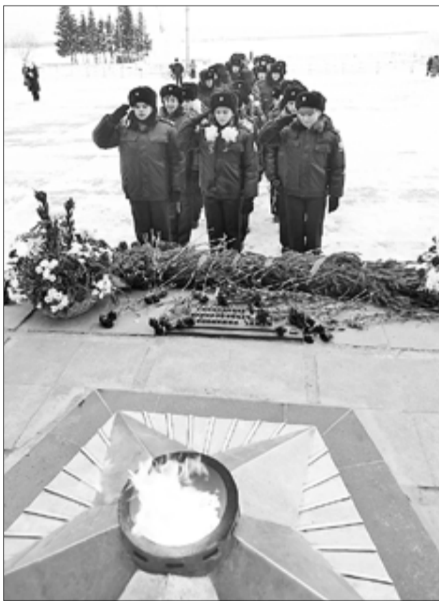
Школьники – постоянные участники всех патриотических мероприятий.

Во второй возрастной группе было представлено 93 рисунка, а победу одержала четвероклассница школы № 10 Карина Варакина.