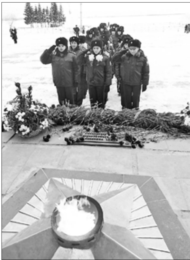
Школьники – постоянные участники всех патриотических мероприятий.